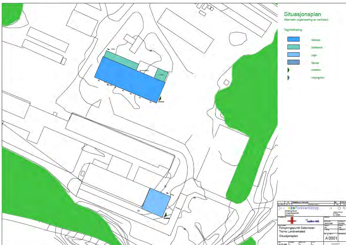
Situasjonsplan for utbygging av verkstedområdet