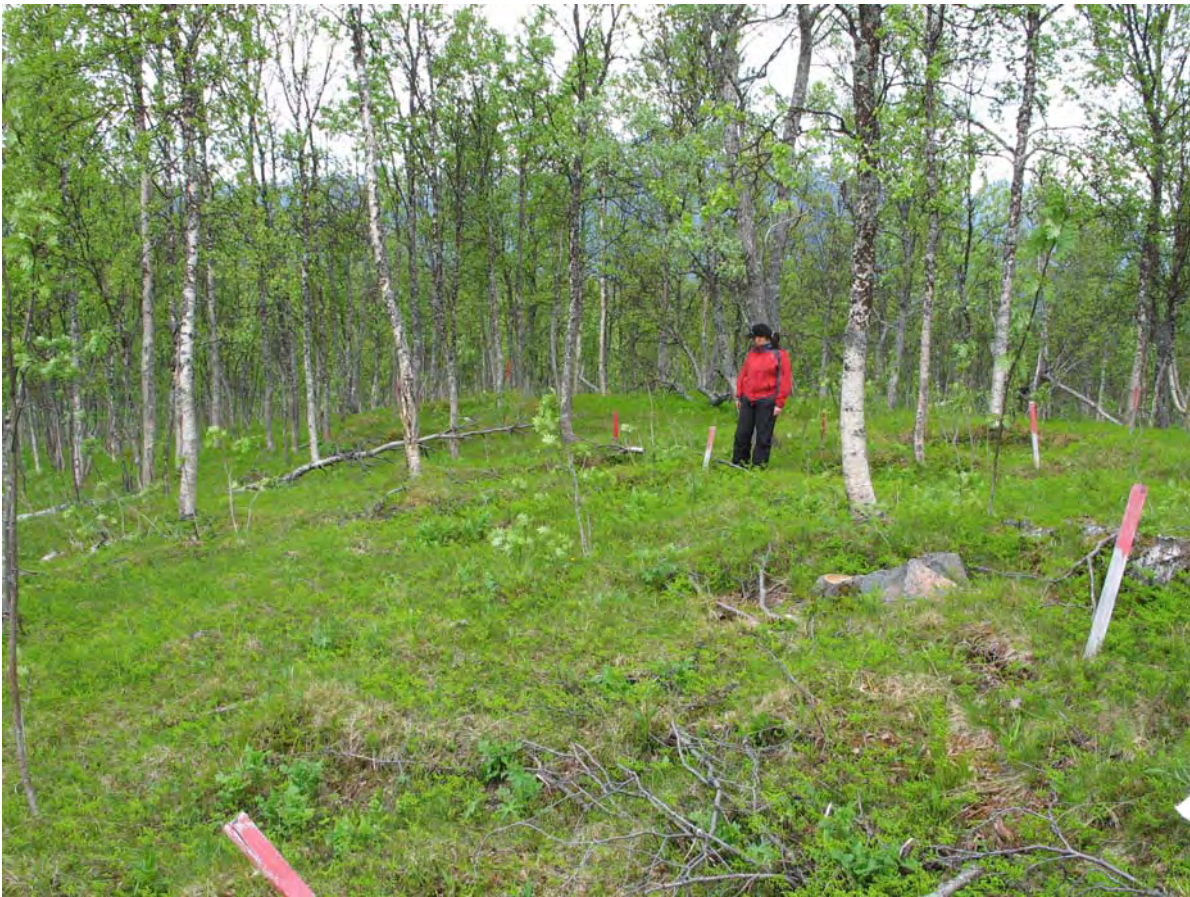
Tuftene i Neslia har behov for nymerking