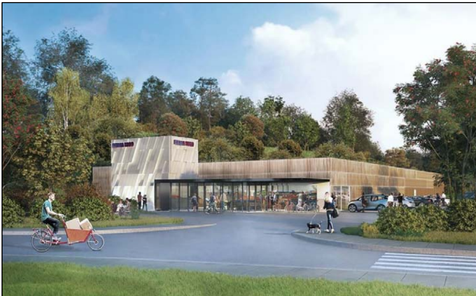
Figur 2: Eksempel fra en annen prosjektert REMA-forretning. Det planlegges et tilsvarende uttrykk for REMA 1000-butikken i Setermoen.

For fasadekledning ser tiltakshaver ser for seg å tilføre innslag av tremateriale med farger i tråd med estetikkveilederen. I figur 2 er en illustrasjon av et annet REMA-bygg med tilsvarende fasadeløsninger. Føringene i estetikkveilederen anses å bli ivaretatt.