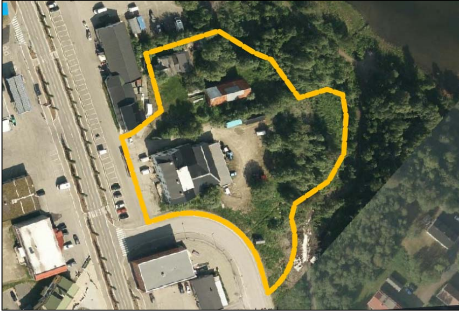
Figur 1: Flyfoto for området som viser dagens situasjon. Plangrensen er vist med oransje stiptet linje.